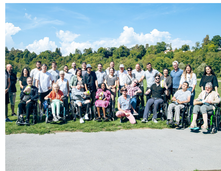
Ramassage de déchets au Parc de Vessy et ateliers Rugby entre les Equipes Premières & Espoirs et les Résidents du Foyer Handicap.