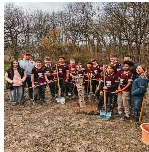
La belle initiative des U14 qui plantent des arbres dans l'ancien Verger d'Onex.