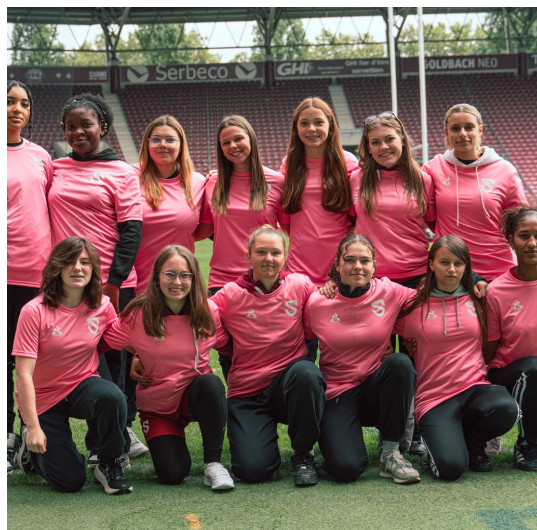
Nos féminines portaient le maillot rose en soutien à l'opération Octobre Rose.