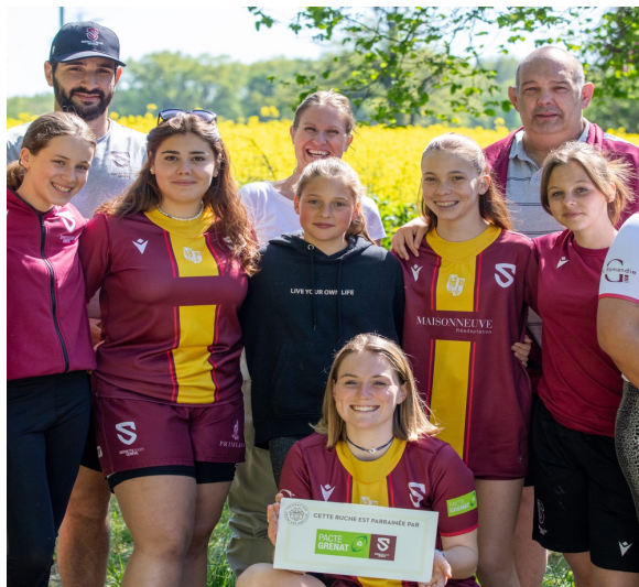
Visite de la ruche du SRC de Fondation Arche des Abeilles pour nos Féminines U18.