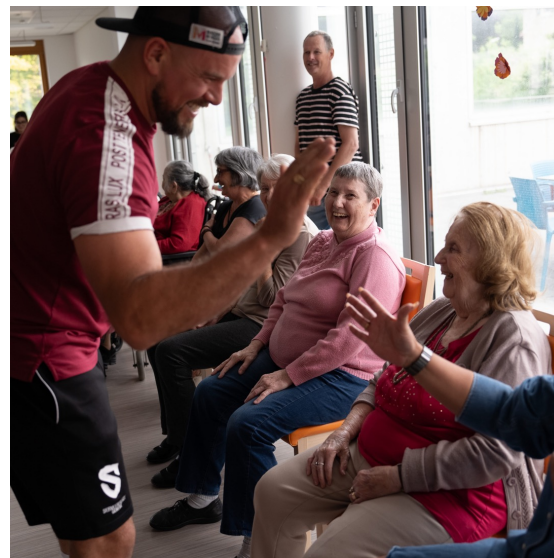
Rencontre entre l'équipe Première et les résidents du Foyers du Jour de Livada et du Caroubier.