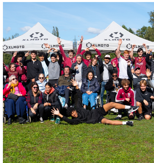
Magnifique rencontre entre le Foyer Handicap et nos U18.