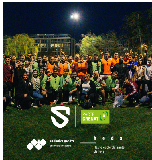
Intervention des Espoirs « soins palliatifs » à L'Ecole de Santé de Genève.