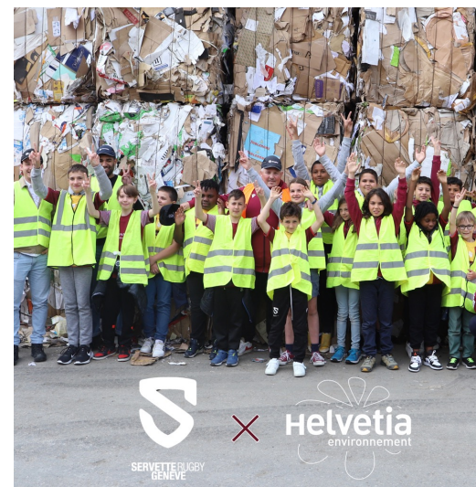
Notre EDR en visite au centre de tri chez Helvetia Environnement.